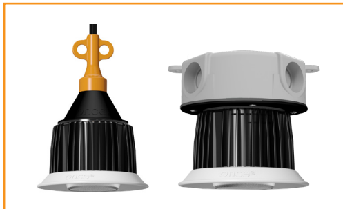
适用于种鸡的 AgriShift® MLL