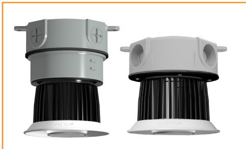
适用于肉鸡的 AgriShift® MLB