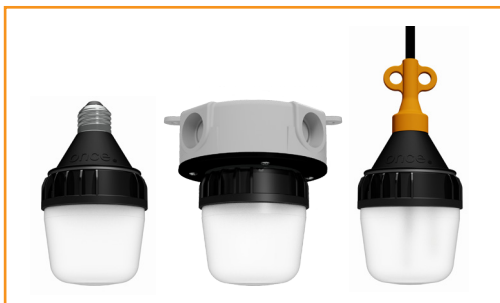
适用于肉鸡的 AgriShift® MLM-B