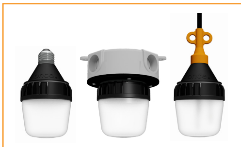
适用于皱鸡的 AgriShift® MLM-G