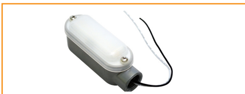
适用于肉鸡的 AgriShift® FL